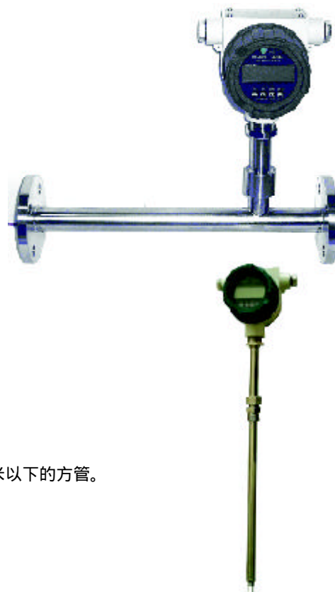
表 2: 插入式